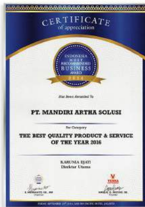
THE BEST QUALITY PRODUCT & SERVICE OF THE YEAR