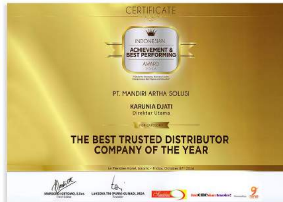
THE BEST TRUSTED DISTRIBUTOR COMPANY OF THE YEAR