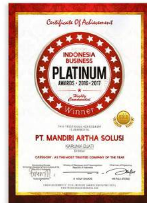
THE MOST TRUSTED COMPANY OF THE YEAR